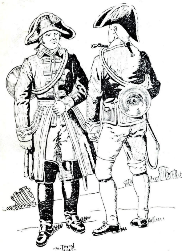
Livrées de chasses impériales 1810. Piqueur à gauche et valet de chiens à droite. L'habit et la veste sont vert impérial, gilets et culottes rouges. Le piqueur porte des bottes à entonnoir, tandis que le valet a des bas blancs.

L'Empereur arrive. Il suit le faux-fuyant sablé tracé