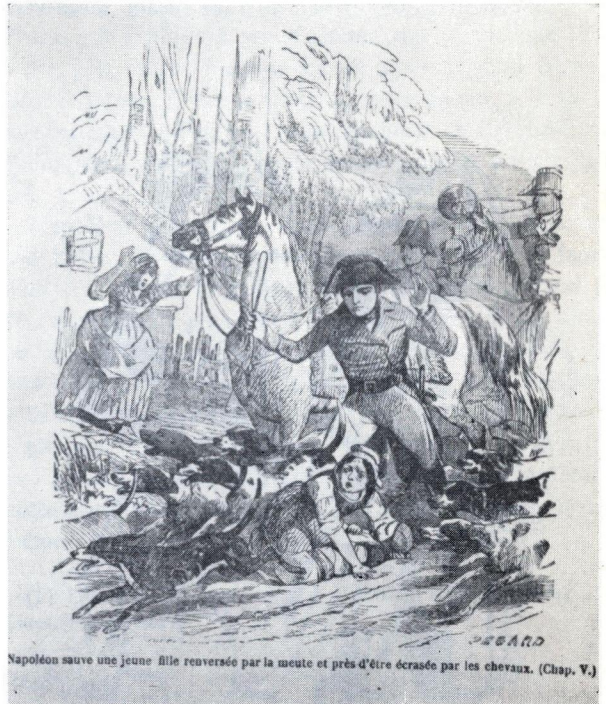
Napoléon sauve une jeune fille renversée par la meute et près d'être écrasée par les chevaux. (Chap. V.)

— Ce n'est rien, dit le chirurgien, après examen ;